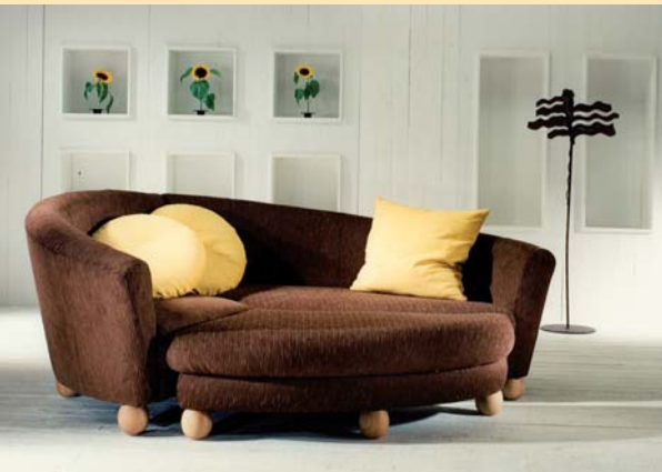
EBENSO SCHÖN WIE GEMÜTLICH: NATÜRLICHE MÖBEL AUS EDLEN MATERIALIEN VON LÖWE.