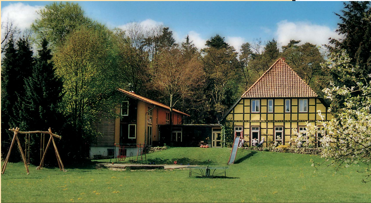
Das ist Kenners LandLust, das einfach andere Bio-Hotel ...