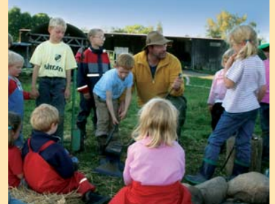
... mit vielen Kindern ...