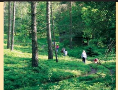
... das grüne, mit viel Wald ...

Ich wünsche mir Cafés und Läden mit Spielecken, damit Kinder nicht „rumnerven“ müssen, damit Eltern länger bleiben, damit Nachbarn anderer Leute Kinder kennenlernen. Ich wünsche mir Menschen, die Kinder direkt ansprechen. Ich wünsche mir Offenheit im Miteinander – lassen Sie Kindern den Platz, selbst Kontakt aufzunehmen, antworten Sie nicht zu früh für die kleinen Schüchternen, sie brauchen Zeit. Lassen Sie uns den Kindern Zeit schenken, mit uns und mit anderen Menschen. Ich wünsche mir Eltern, die neben ihren Kindern sitzen, sie behüten, und den Platz lassen für den Kontakt mit anderen. Belohnt werden wir dafür reichlich, denn Kinder sind wunderbar.